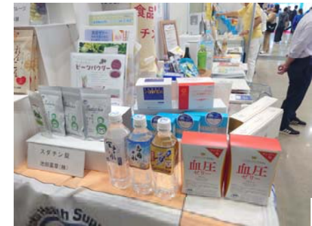
(ヘルシー・フォー認証食品展示)