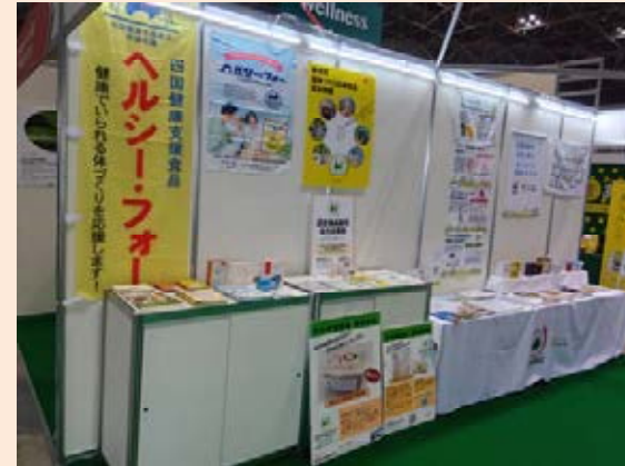
ウェルネスフード ジャパン2025