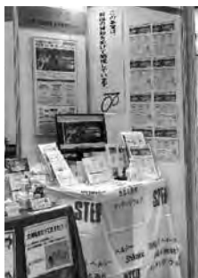
ヘルシー四国(当センター)