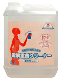
スプレー液詰め替え用 (4L)