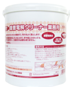
大容量バケツタイプシート (170 mm × 200 mm / 300 枚入り)

★アルカリ電解水はpHが劣化する(中性に戻る)性質がありますが、独自の製法により従来品と比較しても長期に安定