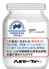
認証マークと食品イメージ